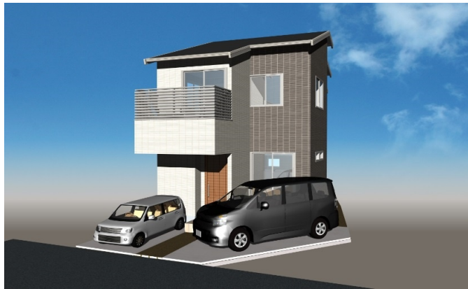
外観イメージパース